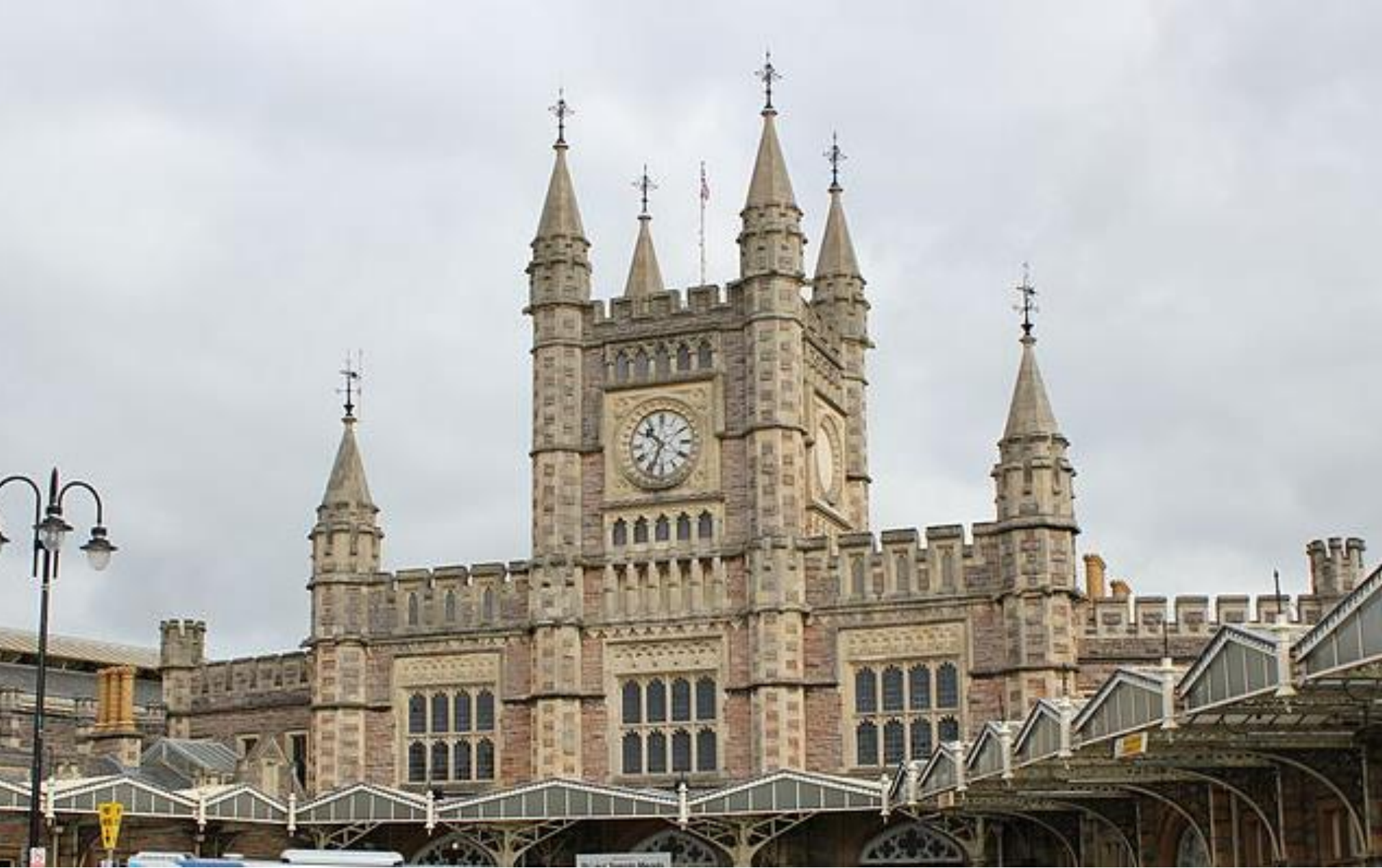
Nádraží Temple Meads v Bristolu I. K. BRUNEL