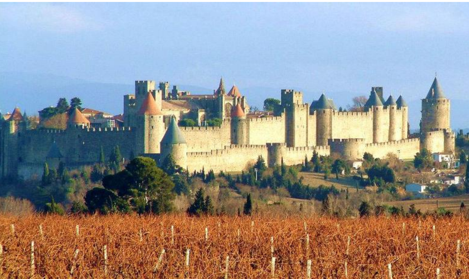
Opevnění města Carcassonne EUGÉNE VIOLLET LE DUC