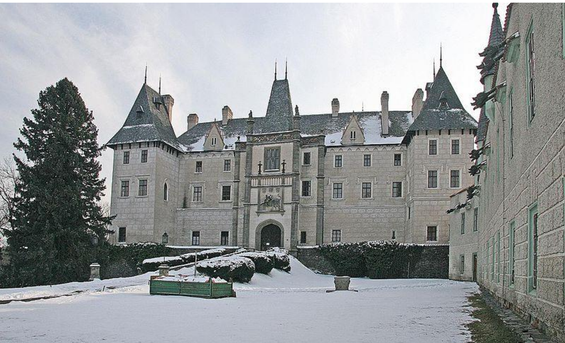
Žleby FRANTIŠEK SCHMORANZ