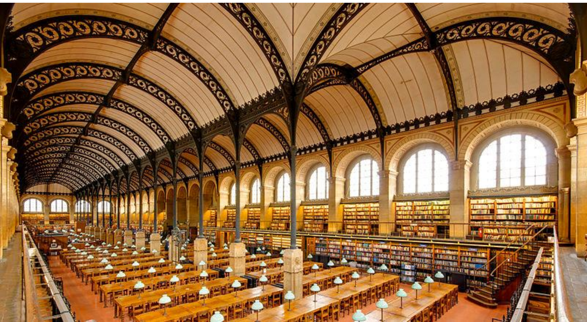
Knihovna Sainte Geneviève HENRI LABROUSTE