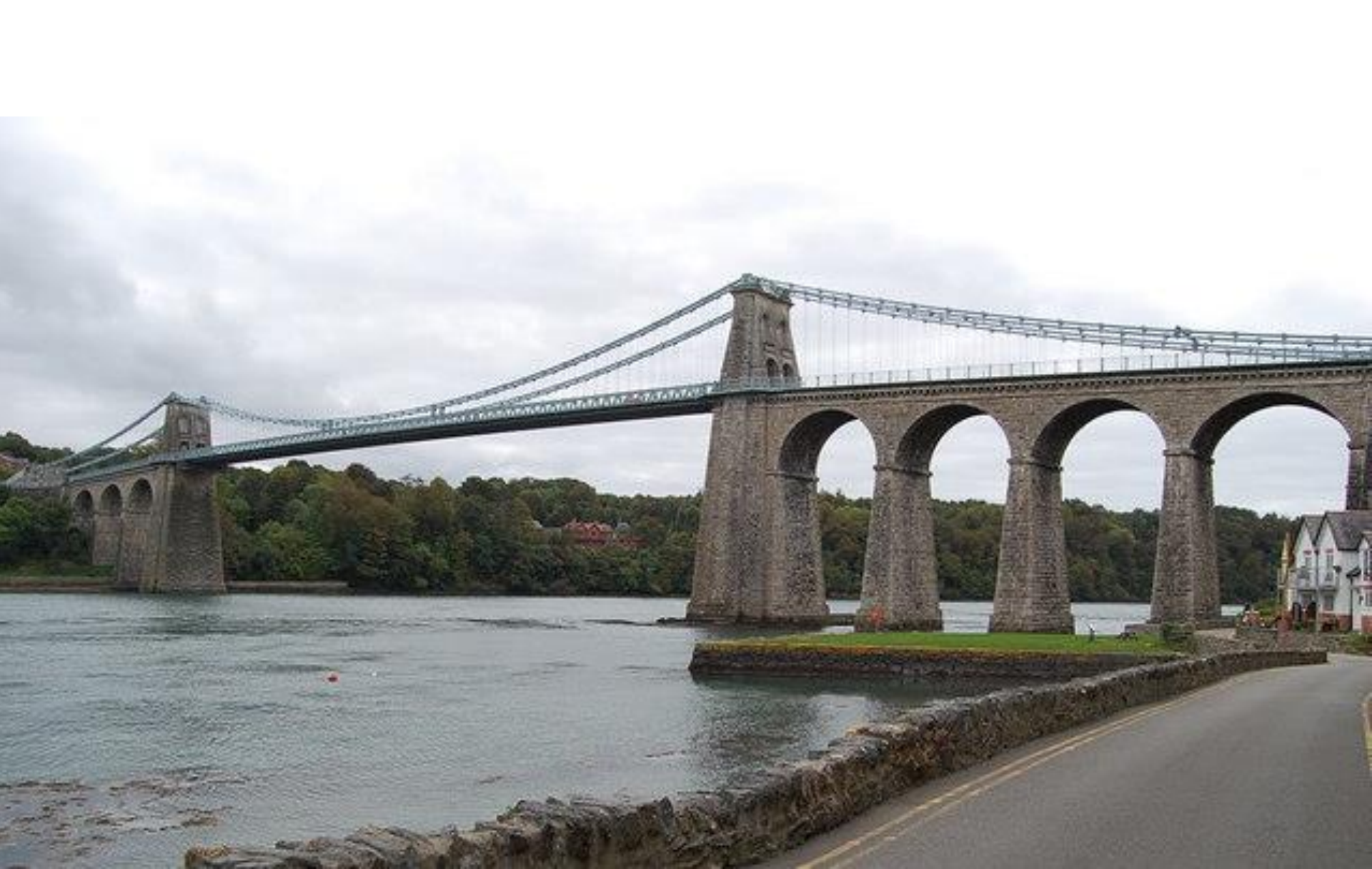
Most přes Menaický průliv THOMAS TELFORD