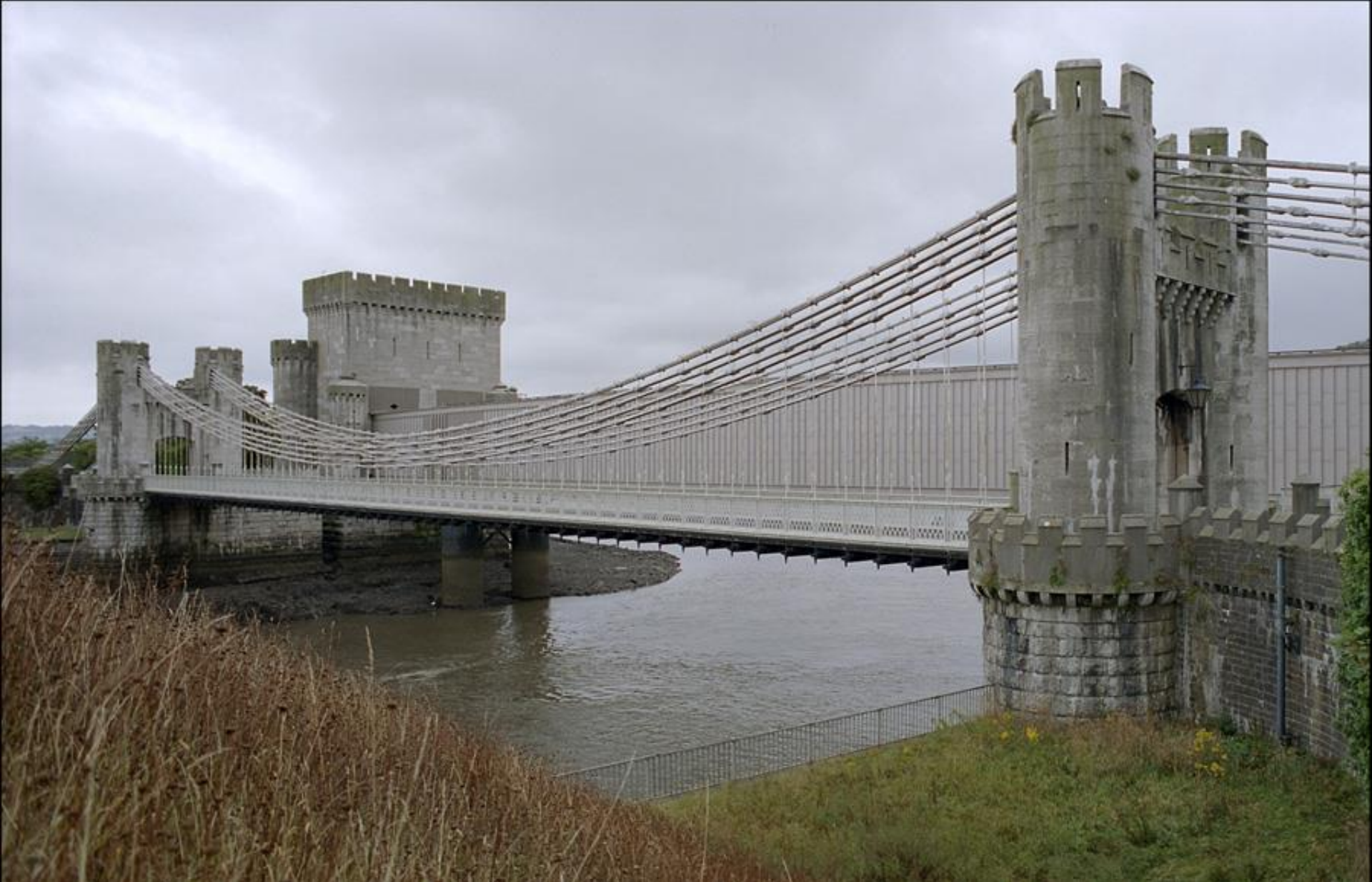
Řetězový most v Conway THOMAS TELFORD