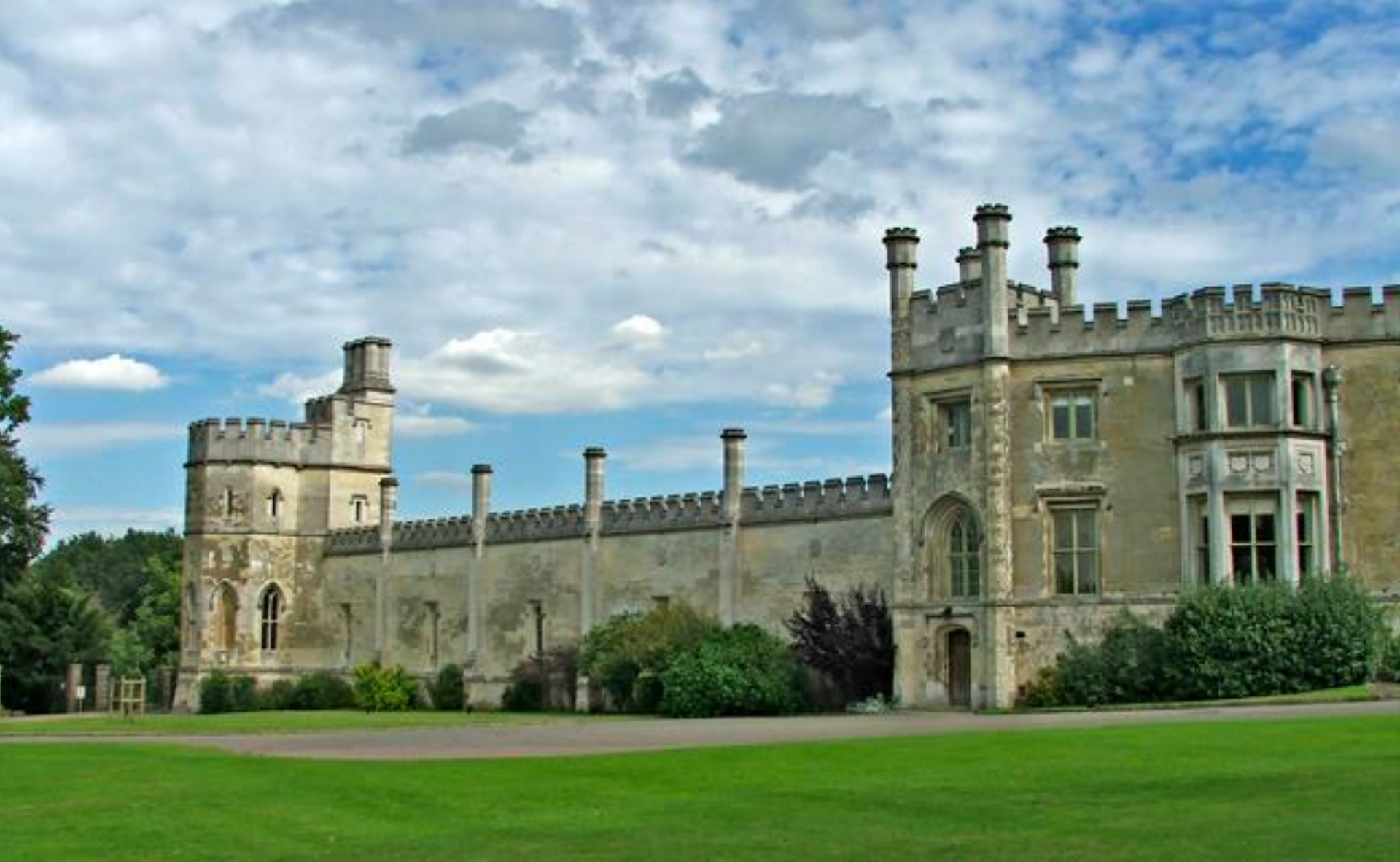
Novogotický zámek Ashridge v Hertfordshire JAMES WYATT